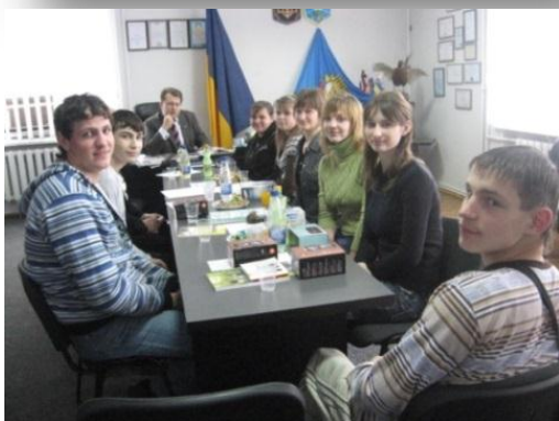
Молодіжні лідери на зустрічі з головою районної ради Софіївського району обговорюють питання молодіжної політики, ролі молодіжних ініціатив в реалізації соціальних проектів