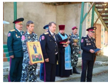
На фото процес посвяти у козаки і козачки Софіївського полку війська Запорозького.