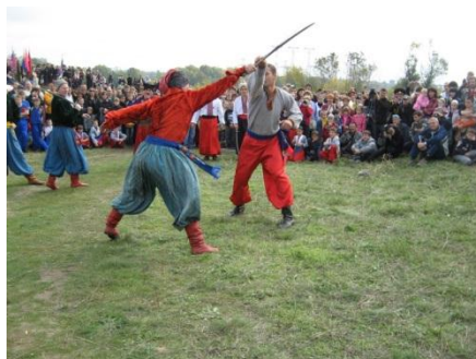
На фото фрагменти козацького фестивалю на о. Хортиця м. Запоріжжя, куди виїжджали учні та викладачі, що входять до ГО «Софіївський полк війська Запорозького» 2010