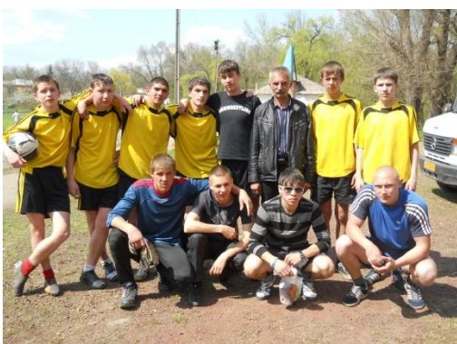
На фото футбольна команда навчального закладу