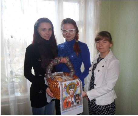
На фото лідери УС з подарунками для учнів до Дня Святого Миколая