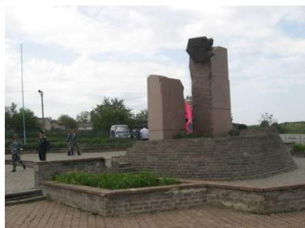
Фотокадр з поїздки до пам'ятника кошовому отаману І.Д. Сірку з нагоди дня його народження с. Капулівка Нікопольського району 2012 рік