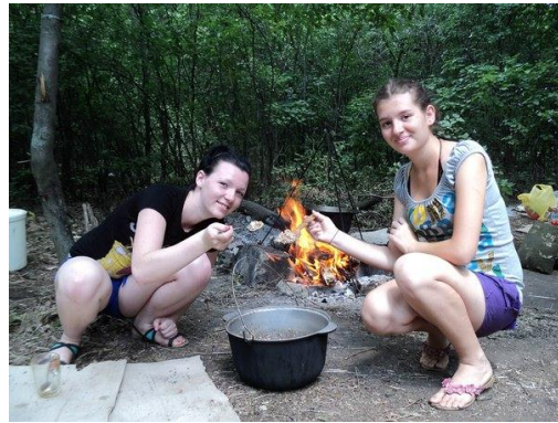
На фото літній виїзний табір