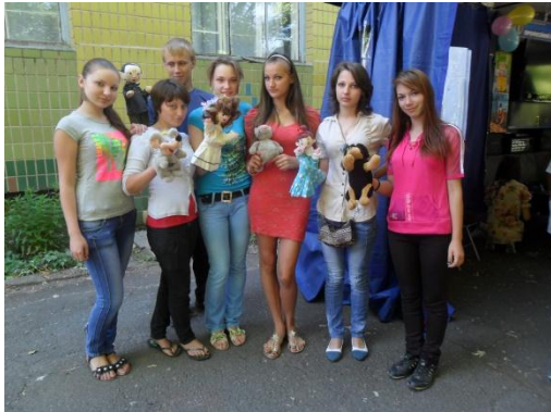
На фото учні з ляльковою виставою для дітей початкових класів