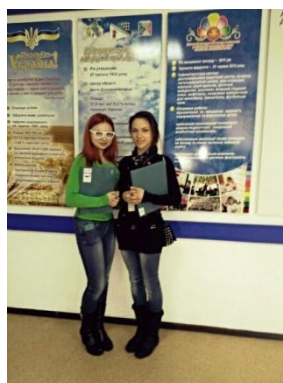
На фото лідери учнівського самоврядування під час проведення обласного молодіжного форуму «Молодь за краще майбутнє»