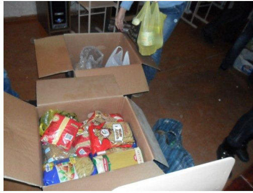
На фото процес зібрання гуманітарної допомоги для військових у зоні АТО