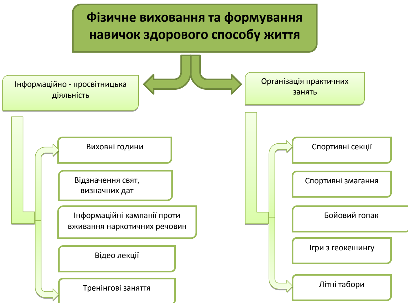
Рис.2 Система фізичного виховання

Наочно систему фізичного виховання можна зобразити у вигляді схеми (рис.2). Серед заходів, що впроваджуються в виховну систему, найбільшу ефективність серед учнів мають проведення активних ігор з геокешингу, виїзні заняття та свіжому повітрі чи в рекреаційній зоні, і звичайно виїзні літні табори, де вдало поєднання тренінгові заняття, ігри, змагання та відпочинок.