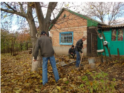
На фото учні допомагають в прибиранні подвір'їв людям похилого віку