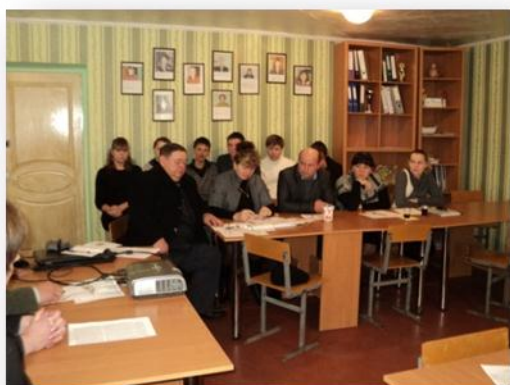
На фото лідери УС приймають участь в зустрічі адміністрації навчального закладу з роботодавцями