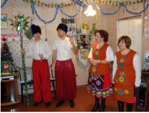
На фото виступ викладачів та майстрів з колядкою під час проведення українських вечорниць