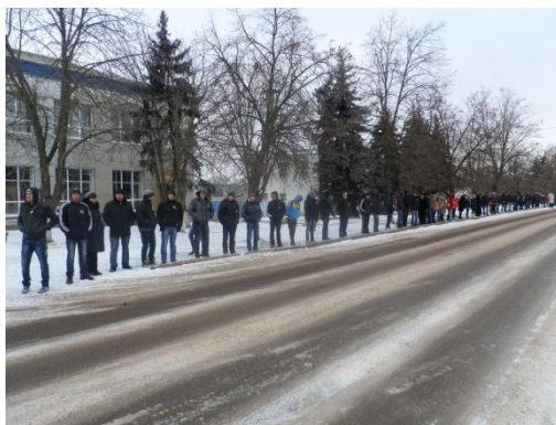
Фотокадр з учнями, які створили «живий ланцюг» до Дня Соборності України.