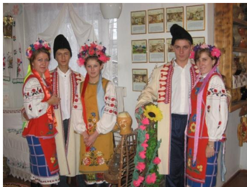
На фото фрагменти виховних годин до Дня української мови та писемності