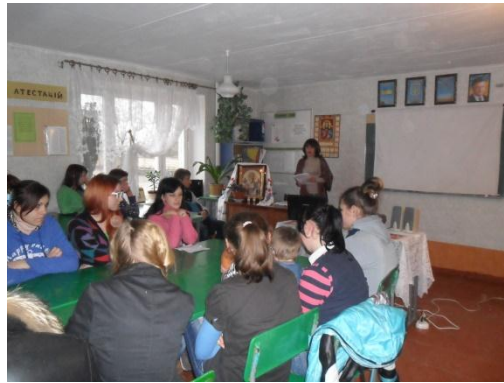
Фрагменти виховних заходів до Дня Святого Миколая та Пасхи