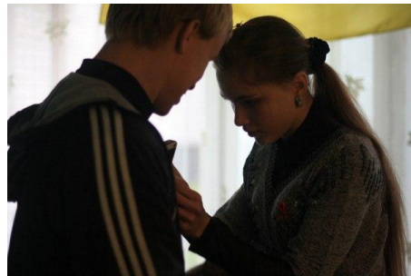
На фото проведення акцій до Дня боротьби з Віл\Снід та до Дня боротьби з тютюнопалінням