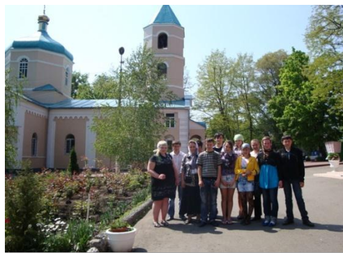
На фото паломницькі поїздки учнів до Свято-Тіхвінського жіночого монастиря м. Дніпропетровськ

Проводяться добродійні акції до Дня Святого Миколая, до дня людей похилого віку. Виховні години до Дня Святого Миколая, Різдва, Пасхи.