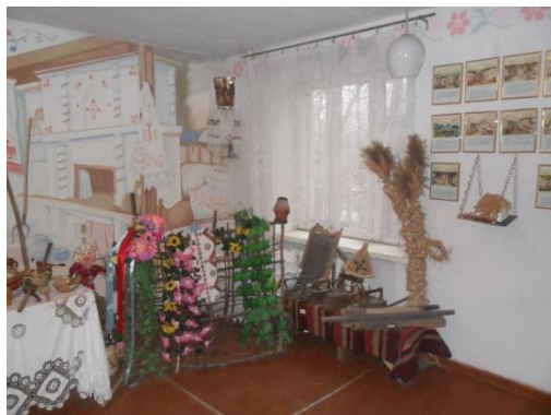
Міні-музей навчального закладу