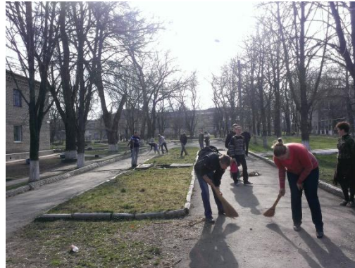
На фото учні під час прибирання центральної вулиці селища