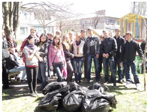
На фото учні під час прибирання дитячих майданчиків