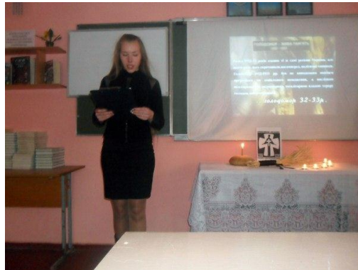
Вшанування пам'яті жертв Голодомору 1932-1933рр.