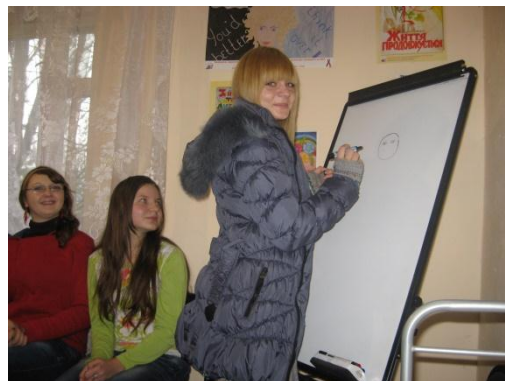
На фото фрагменти з проведення тренінгових занять