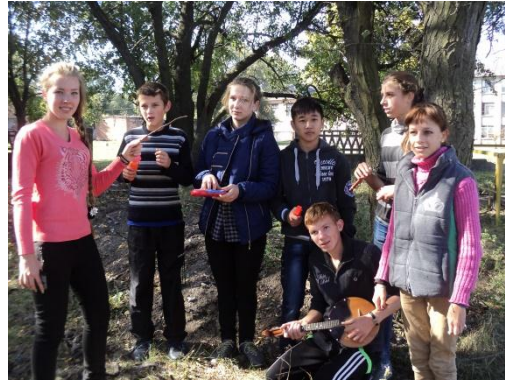
На фото учні під час проведення гри-квест геокешинг