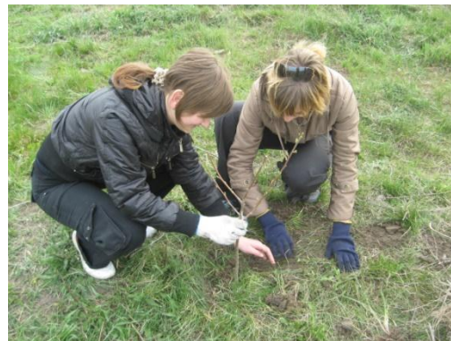
На фото учні висаджують дерева в парку Новий