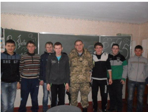
Зустріч з випускниками навчального закладу, учасниками АТО на сході України