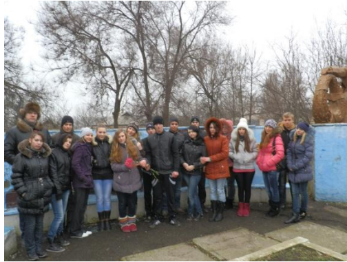
Вшанування пам'яті ліквідаторів аварії на Чорнобильській АЕС