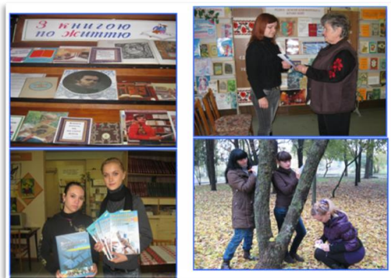
Акція «Свято, яке завжди з нами»