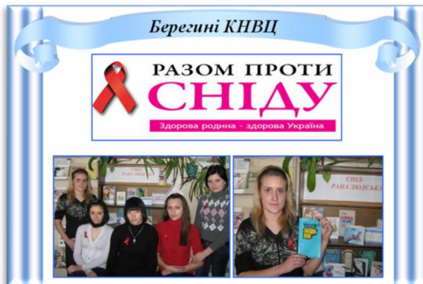
Виховна година «Здорова родина – здорова Україна»