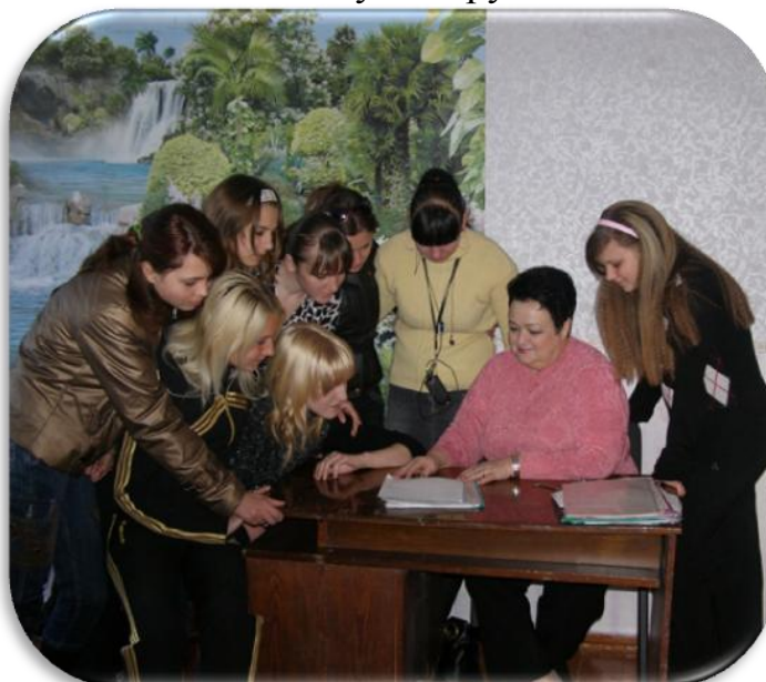
Спілкуємось з психологом

Члени учкому та учні групи завжди звертаються за порадою або допомогою до педагогічного колективу центру.